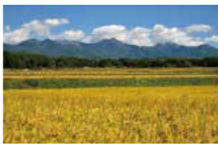
収穫の時期を迎えた田んぼ

5,000年以上前の縄文時代には、すでに多くの人々が住んでいたことが知られている茅野市。「尖石縄文考古館」では、日本最高峰と言われる国宝の土偶二体をはじめ、はるか昔の日本人の優れた文化を見ることができます。また、日本最古の神社のひとつとされる「諏訪大社」には、自然と深く関わる古代の雰囲気が残っています。昔ながらの里山の農村風景からは、現在も受け継がれている、季節とともに暮らす日本の原風景を感じることができます。