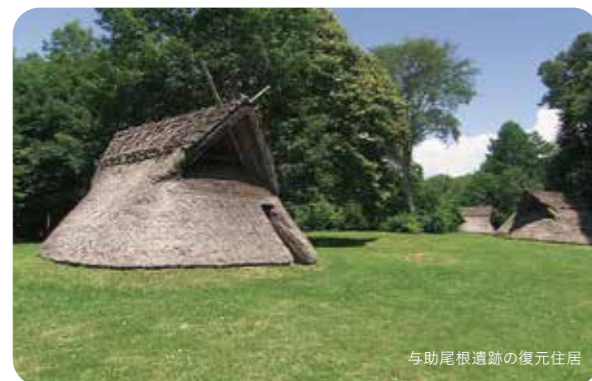
与助尾根遺跡の復元住居