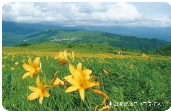
車山高原とニコウキスケ