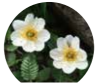
チョウノスケソウ