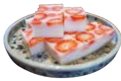
寒天を使った天壽せ