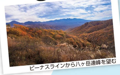
ビナスラインから八ヶ岳連峰を望む